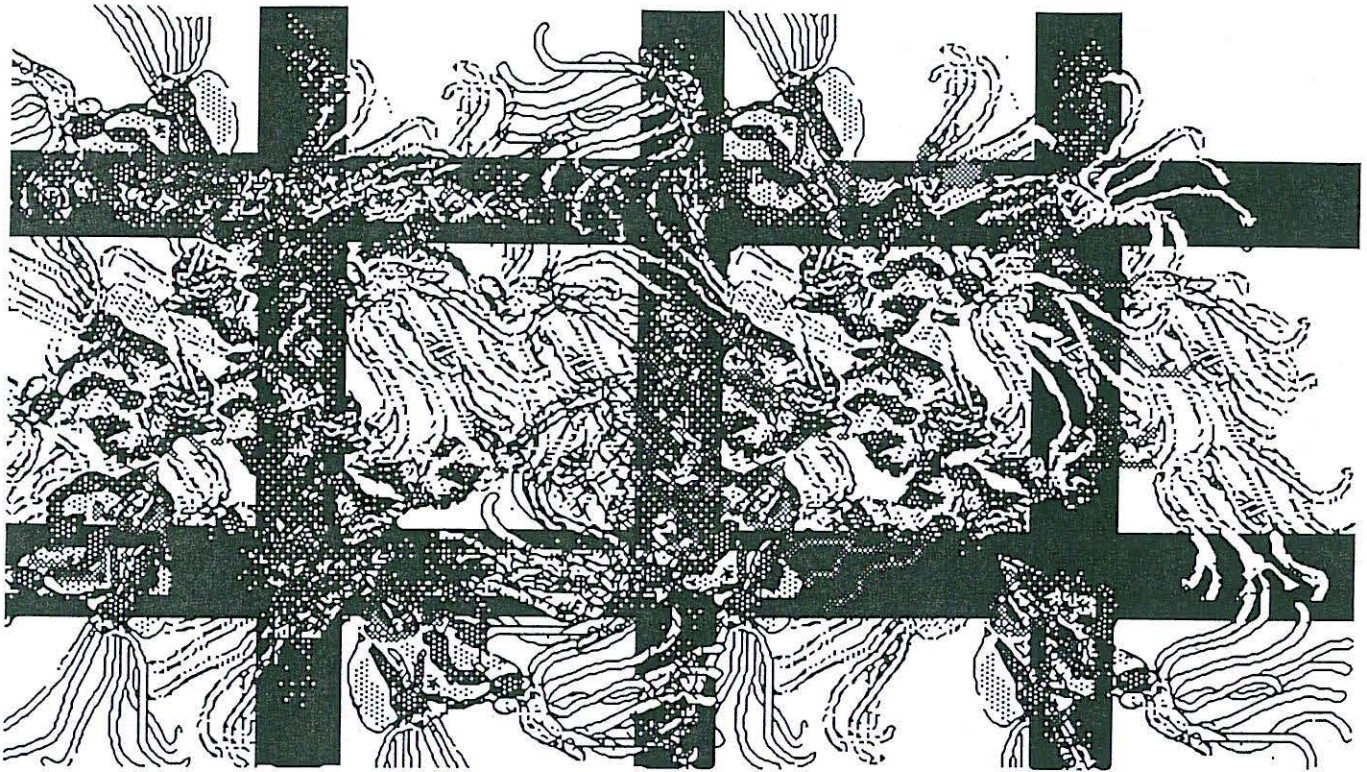
Figura 3. Organismos colonizadores (Colonia de Bryozoarios adherida a la jaula).